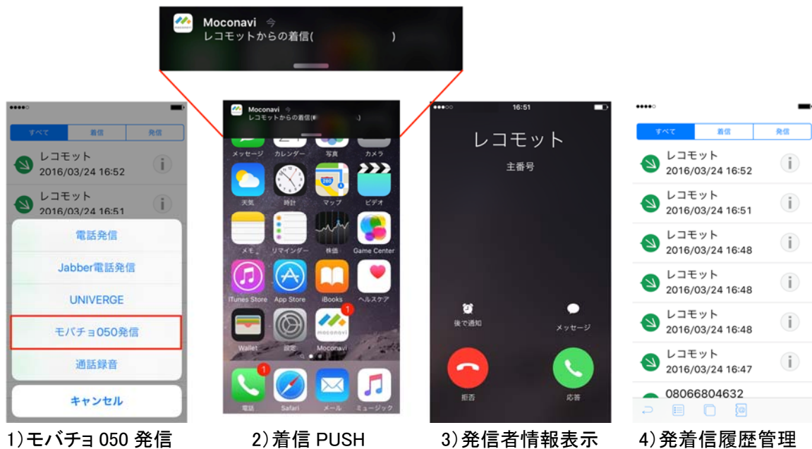
1) モバチヨ 050 発信